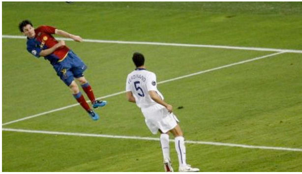
L'équipe espagnole remporte la Ligue des Champions face à Manchester United, grâce à deux buts d'Eto'o et Messi. >>