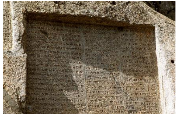
« Dans chaque province selon son système d'écriture » : Inscription trilingue de Xerxès 1er, Forteresse de Van, Turquie, 485-465 avant l'ère commune