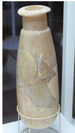
Flacon de parfum en ivoire, Persépolis, 560–331 avant l'ère commune

12 Or, quand arrivait le tour d'une des jeunes filles de se présenter devant le roi Assuérus, après le délai réglementaire assigné aux femmes, c'est-à-dire au bout de douze mois révolus, [après la fin du traitement esthétique, dès lors qu'elle était prête à rencontrer le roi en accord avec les standards de beauté en vigueur] car ce temps était pris par les soins de leur toilette, dont six mois pour l'emploi de l'huile de myrrhe [en particulier à des fins d'épilation 22 ], et six mois pour