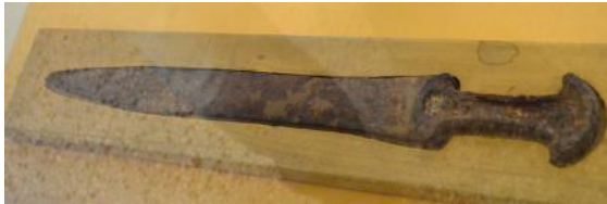
Épée, Persépolis 560-531 avant l'ère commune

nemis, en frappant du glaive, en tuant, en détruisant, et ils traitèrent à leur gré ceux qui les haïssaient.