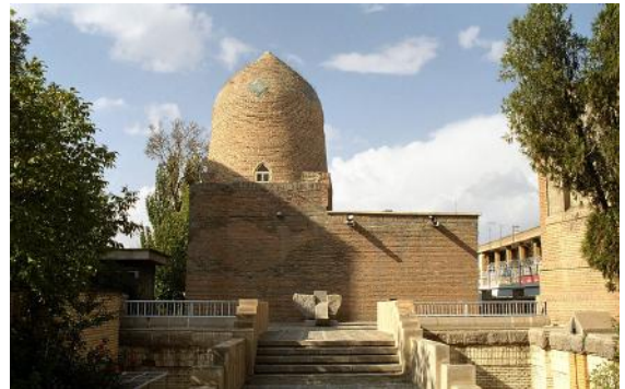
Tombeau présumé de Mardochée et Esther à Hamadan (Iran, ouest)

de tous ses descendants [tous purent ainsi bénéficier de sa grandeur].