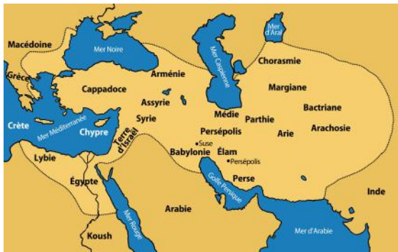
Carte de l'empire perse