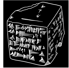
Dé du sort de Yahlu : illustration à partir d'un dé en pierre, Assyrie, neuvième siècle avant l'ère commune