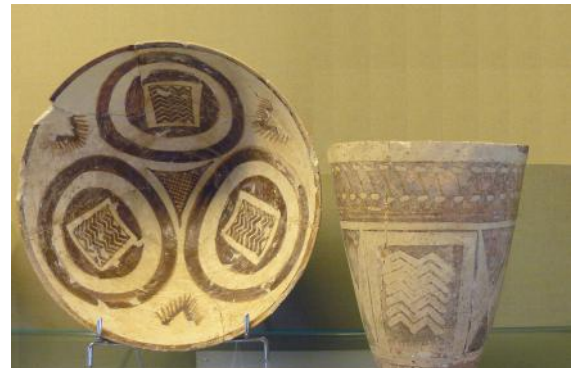
Ustensiles excavés, Suse