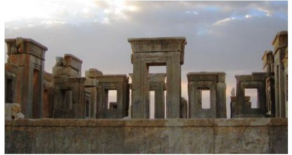
Portes du palais des rois de Perse, Persépolis, cinquième siècle avant l'ère commune

Les versets suivants présentent un épisode a priori secondaire, qui, néanmoins, s'avérera par la suite une importante pièce de la toile du récit.