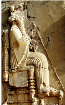
Darius assis sur son trône, Cinquième siècle avant l'ère commune

éprouvée à son égard lorsqu'il l'avait choisie comme reine se réveilla dans son cœur], et le roi tendit à Esther le sceptre d'or qu'il tenait en main [et par là-même, il lui octroya la permission officielle de se présenter à lui]. Esther s'avança et toucha l'extrémité du sceptre [un tel geste était apparemment requis par le protocole pour accepter la permission].