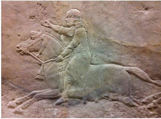
Cavalier, relief de pierre, Ninive 645-635 avant l'ère commune

les lettres par des courriers à cheval, montés sur des coursiers rapides [de la plus belle race, appartenant au roi 64 ], sur des mules 65 nées de juments 66c .