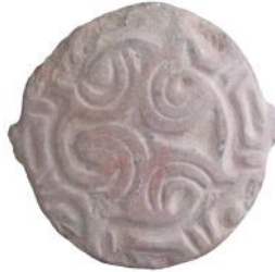
Sceau monté sur anneau, Suse, troisième siècle avant l'ère commune

le contrôle des plus vastes régions], des gouverneurs C de chaque province et des seigneurs de chaque nation [qui administreraient moins de sujets] en conformité avec le système d'écriture de chaque nation et l'idiome de chaque peuple C : le message [consignant le décret royal] était écrit au nom du roi et scellé du sceau royal.