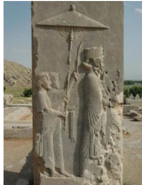
Xerxès 1 er (auquel Assuérus est traditionnellement identifié), relief de pierre daté de 560-331 avant l'ère commune