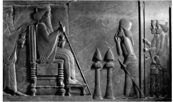
Roi de Perse sur son trône, recevant une audience royale, relief de pierre daté de 560-331 avant l'ère commune, Persépolis