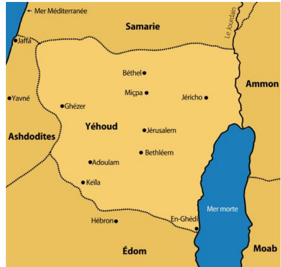
Province de Yéhoud