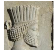
Couronne royale perse