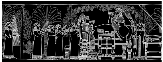
« Pendant le banquet, à l'heure du vin »