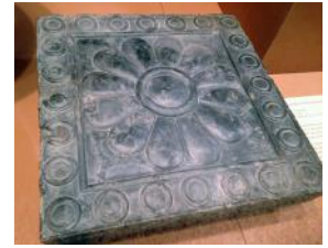
Carreau décoré, palais du roi de Perse, Persépolis, cinquième siècle avant l'ère commune.