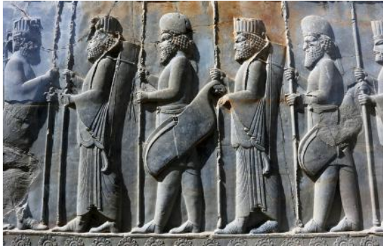
Soldats perses (aux chapeaux droits) et mèdes (aux chapeaux ronds), haut-relief, Persépolis, sixième siècle avant l'ère commune