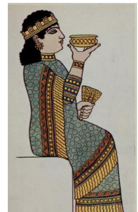
Reine d'Assurbanipal en habit royal, à partir d'un relief de pierre, septième siècle avant l'ère commune

Si la méguilla ouvre son récit par la description de festins publics, ce chapitre relate en revanche les festins intimes auxquels Esther invite le roi et Haman. Un autre contraste : Vashti avait violé la loi en refusant de se présenter devant le roi qui l'avait convoquée, alors qu'Esther, à son tour, transgresse la loi en osant se présenter devant