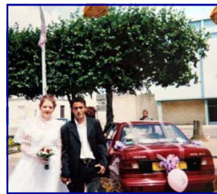
Mission accomplie avec trop de souplesse

Dans les deux cas, des manifestations publiques accompagnent les procédures judiciaires légitimement ouvertes. Il est permis, il est nécessaire, cependant, de se demander si ces deux authentiques drames person-