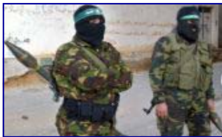
Pas un mot contre le Hamas

Impossible, ici encore, de suggérer – même timidement – même du bout de la plume – que celui qui pose en victime a contribué pleinement à la contribution d'un dommage dont il ne cesse de se repaître avec une délectation morbide.