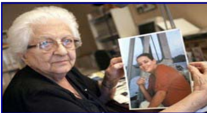
Celui D'Agnès Le Roux non plus

J'envie la certitude de ceux qui vocifèrent contre des juges qui ont rendu un