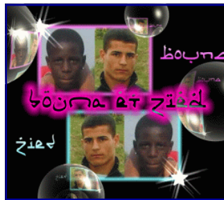
Mission accomplie avec trop d'empressement