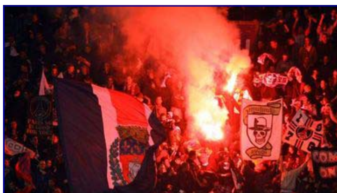
Des supporters avaient engagé dès la fin du match une "chasse" aux supporters de Tel-Aviv, sans cacher leurs buts antisémites

L'information judiciaire pour "coups volontaires ayant entraîné la mort sans intention de la donner et violences avec armes" se poursuit. Antoine Granomort ne sera pas suspendu judiciairement et il ne sera pas jugé. Le juge, qui a suivi les réquisitions du par-