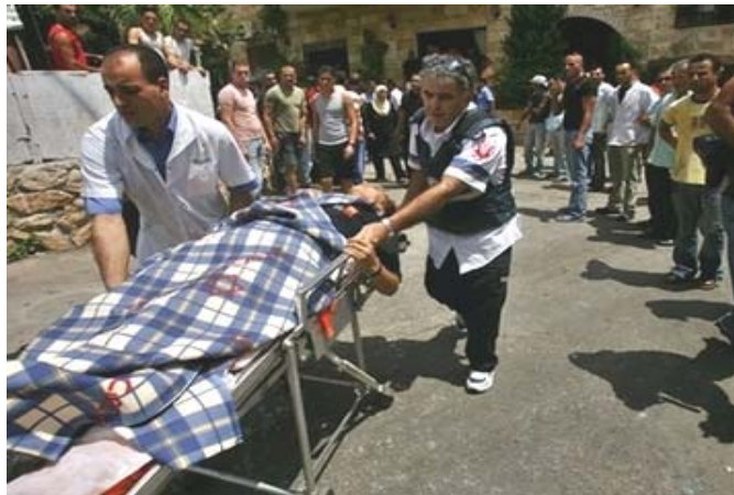
Cette photo-là n'est pas truquée Une femme israélienne touchée par le missile qui a détruit sa maison dans le Nord d'Israël, à Deir Al-Assad

Le Hezbollah organisait des visites de presse quotidiennes pour exhiber aux journalistes les dommages infligés par les frappes aériennes israéliennes. L'emplacement d'où le Hezbollah lançait ses rockets ne fut jamais révélé, surtout que la plupart d'entre elles furent lancées au départ d'écoles, d'hôpitaux et de maisons privées. Pas un photographe, non plus ne s'est jamais soucié de rechercher, ne fut-ce qu'un seul « combattant » du mouvement terroriste Hezbollah ! Les photos des soldats de Tsahal, par contre, envahirent les rédac-