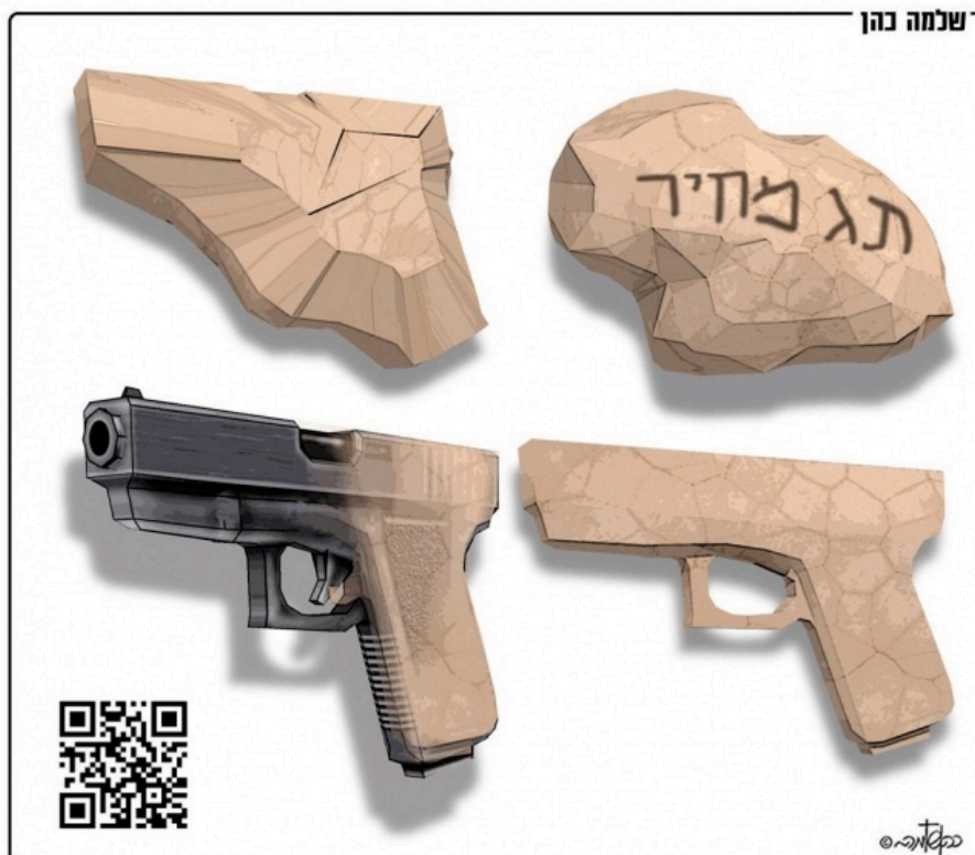
La pierre des opérations du « prix à payer » se métamorphose en pistolet Caricature de Shlomo Cohen, Israël Hayom 15.12.11

Tant que la société israélienne ne fera pas un véritable examen de conscience quant à ce qui se fait au-delà de la « ligne verte », on ne parviendra pas à éradiquer cette délinquance.