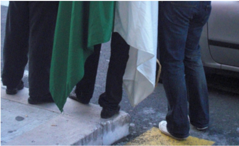
Pro-palestiniens ou pro-algériens ?