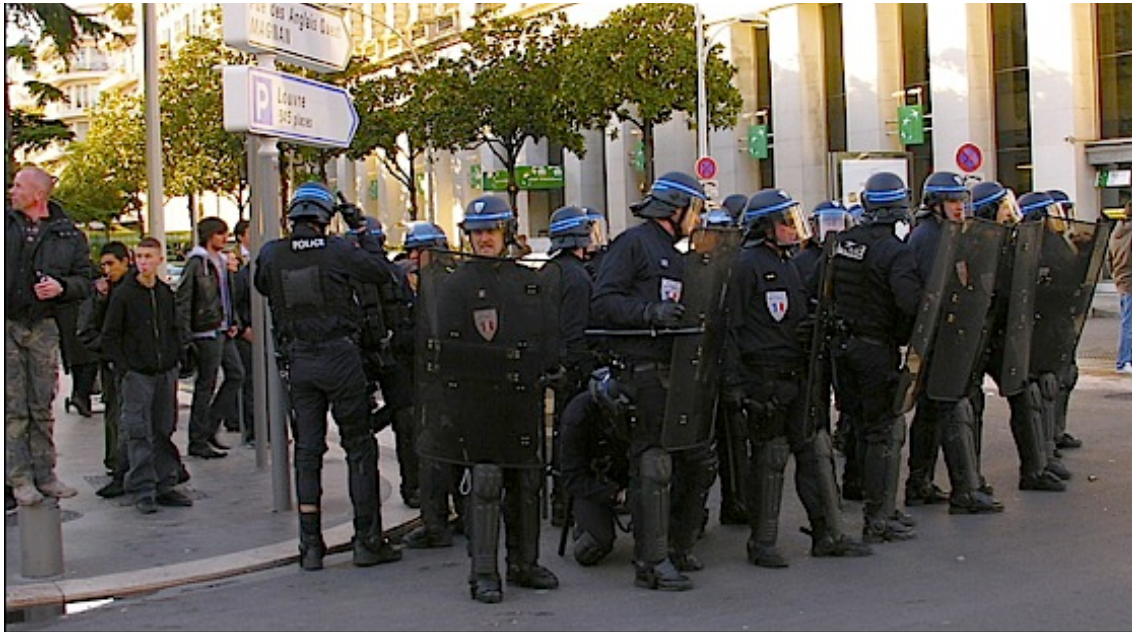
Les CRS sont trop peu nombreux pour canaliser la haine des manifestants