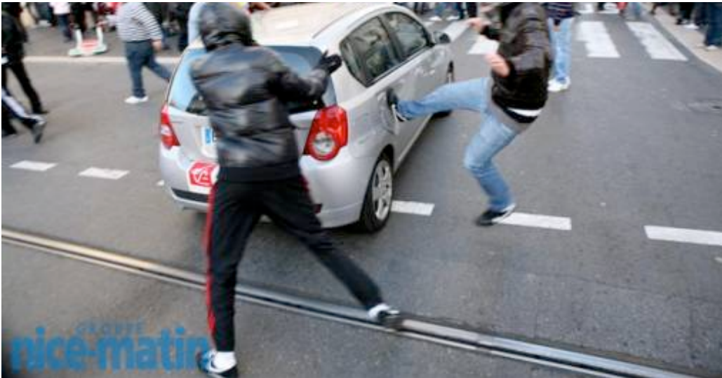
Les manifestants pro-palestiniens s'en prennent aux riverains qui voient leur voiture prise à partie et endommagée.