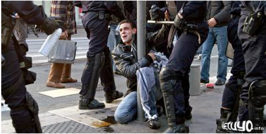
Incidents à Nice lors de la manifestation pro-palestinienne