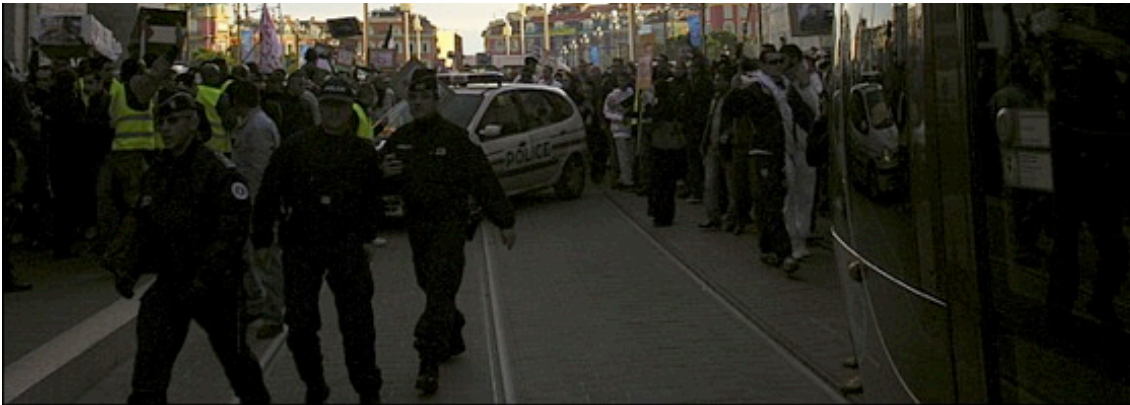
Manifestation anti-israélienne à Nice