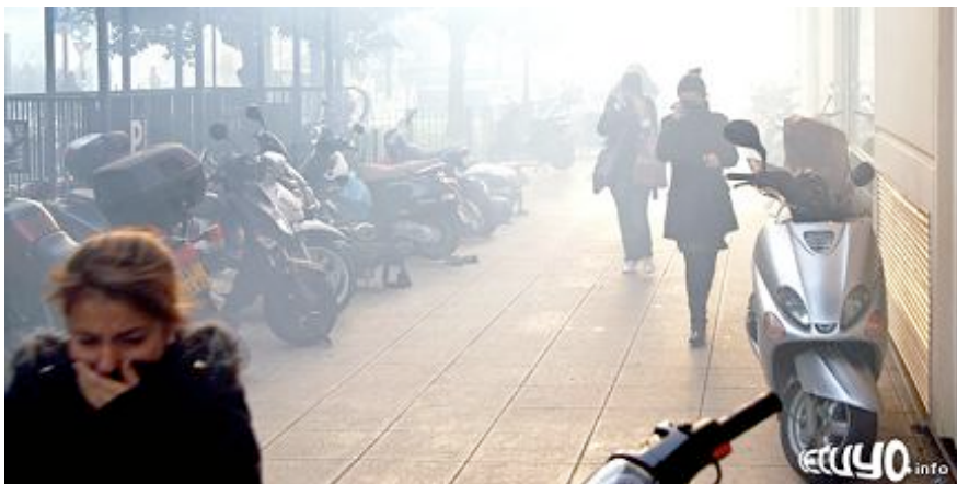
Violents incidents à Nice lors de la manifestation pro-palestinienne, en pleine période de soldes.