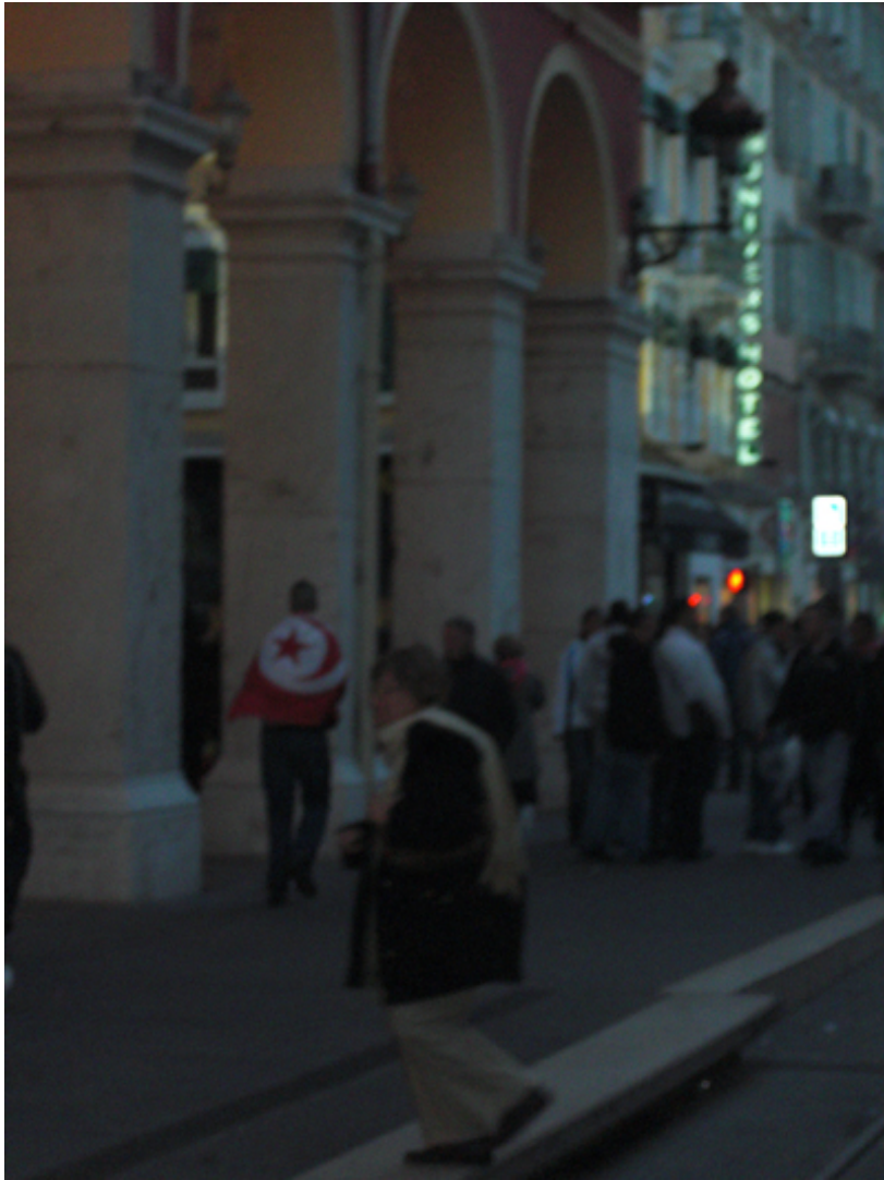
Nice dans le désordre pro-palestinien

Des gaz lacrymogènes sont utilisés afin de disperser les manifestants pro-palestiniens violents.