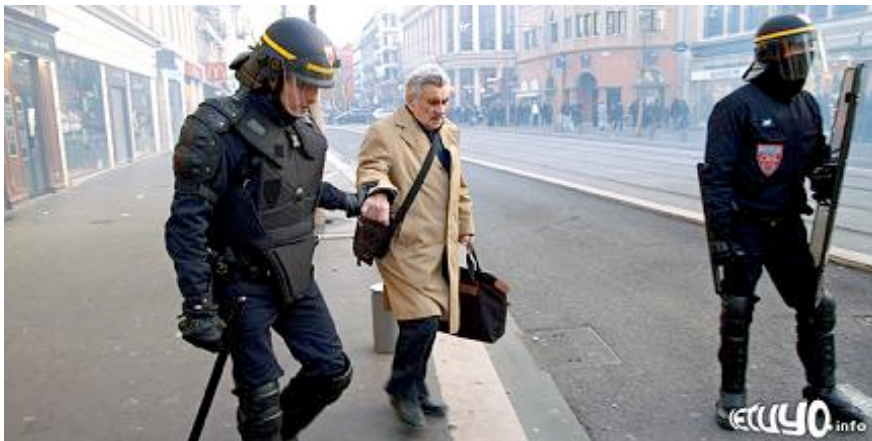
Des personnes âgées sont aidés et protégés par les forces de l'ordre françaises, policiers et CRS.