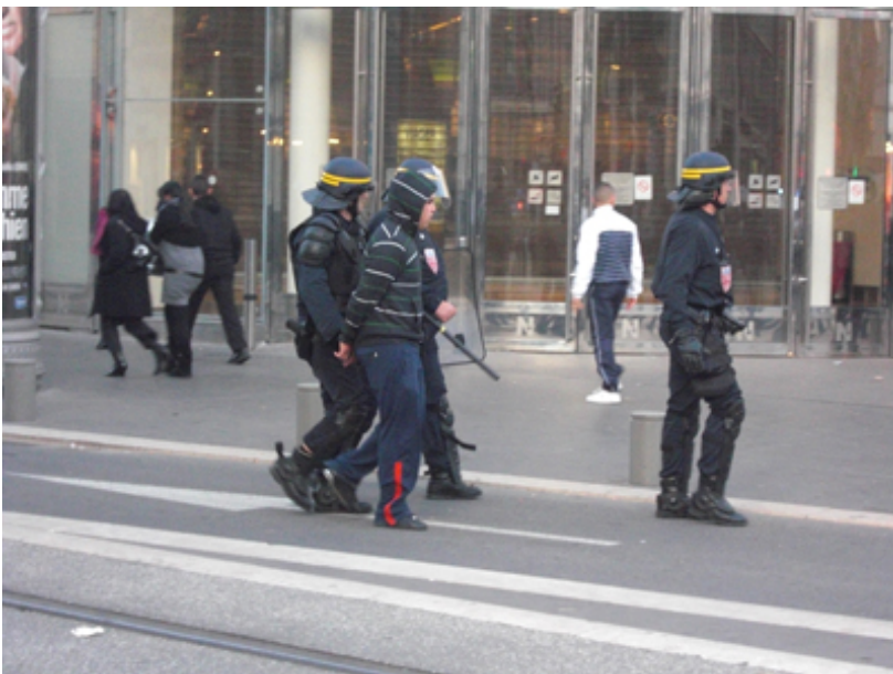
Les CRS procédant à des interpellations