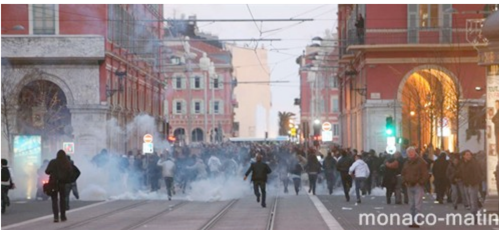
Les CRS parfois sans défense, dépassés par la violence des manifestants.