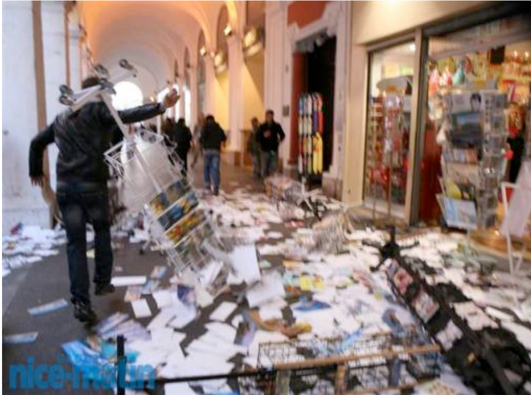
Une boutique saccagée par des manifestants pro-palestiniens à Nice.