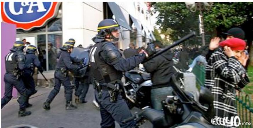
Violents incidents à Nice lors de la manifestation pro-palestinienne