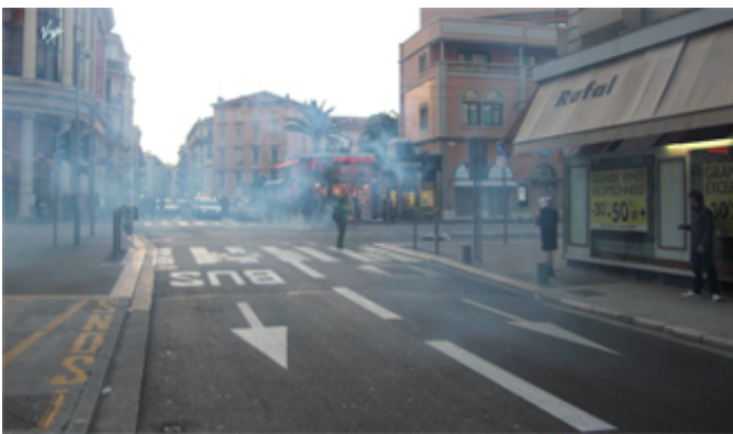
Les manifestant fuient sous les gaz lacrymogènes.