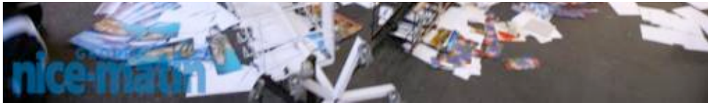
Les manifestant on pillé quelques boutiques et on saccagés de nombreux magasins.