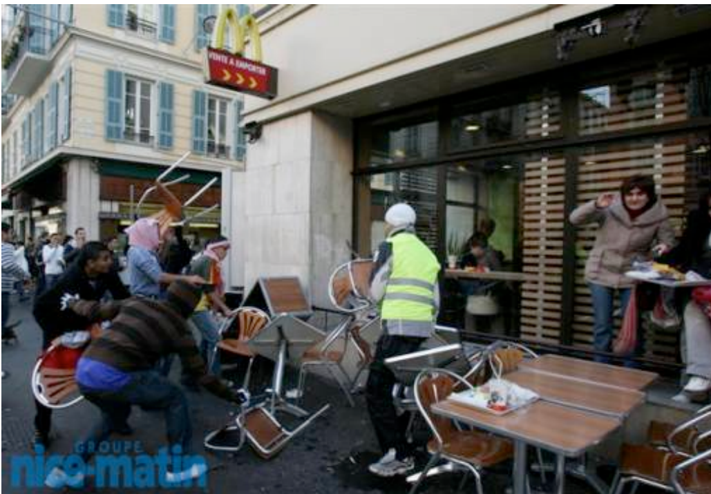
Les manifestants pro-palestiniens saccagent un Mac Donald en plein centre de Nice

Tags: anti-isréliens | anti-juifs | avenue Jean-Médecin | boulevard Gambetta | casino Ruhl | centre commercial Nice Étoile | CRS | grenades lacrymogènes | groupe Barrière | hamas | Intifada | Mac Donald | Manifestation pro-palestinienne | Nice | Nice Étoile | peuple palestinien | police | pro-palestiniens | Promenade des Anglais | Ruhl | Scènes d'émeute | vitrines du Mac Donald