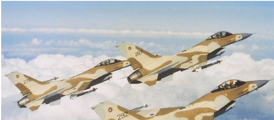
Avions de combat Lockheed Martin F-16C "Fighting Falcon", de l'armée de l'air israélienne (Tahal) en formation.