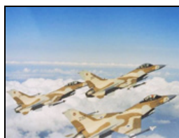
Les manoeuvres qu'Israël préparerait contre l'Iran