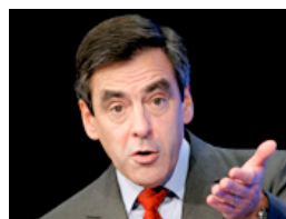
Fillon dévoile le plan "Espoirs-Banlieues"